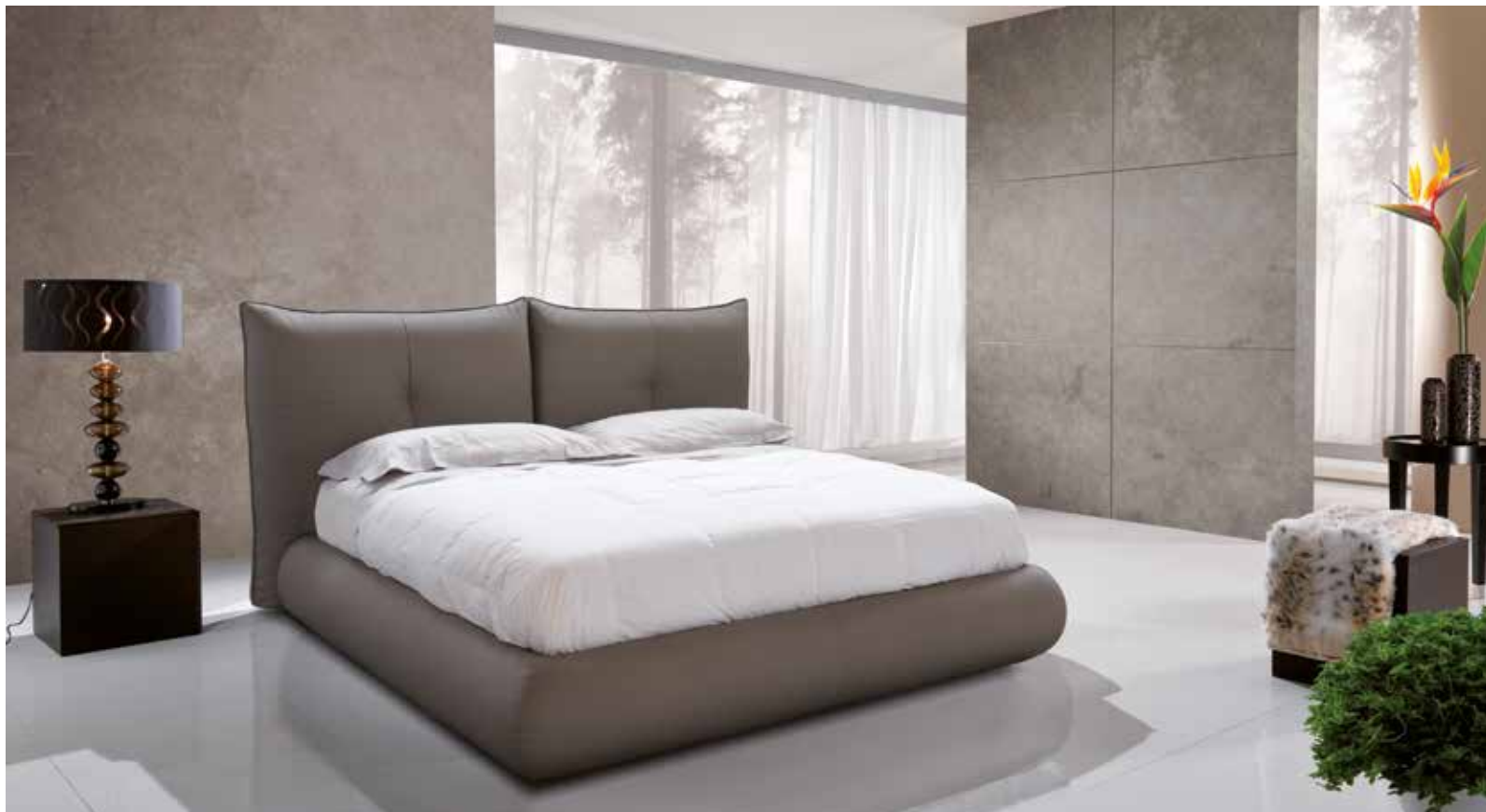
Letto matrimoniale sommier large stondato .

Testata: Struttura tamburata in legno multistrati.